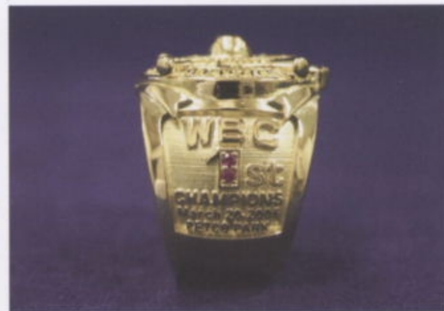
写真：左側面、正面、右側面の計3点

※製作した天賞堂のブログに、リングの詳細や製作にまつわる話などが掲載されています。